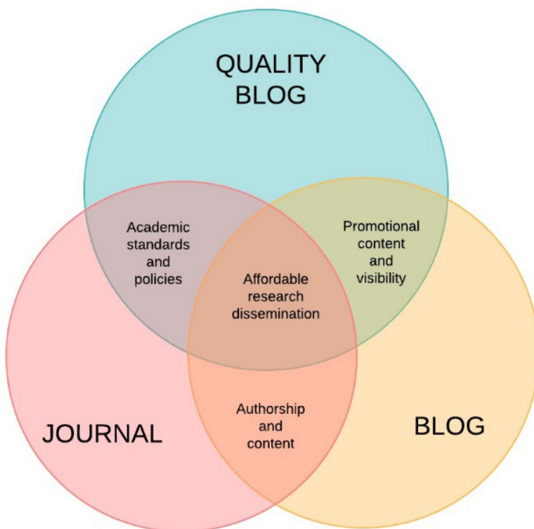
Figura 1: Rappresentazione del posizionamento del Blog di qualità rispetto ai due formati tradizionali di riferimento.

Nello schema seguente illustriamo il posizionamento del “Blog di qualità” rispetto agli altri due principali formati standard (Fig. 1).