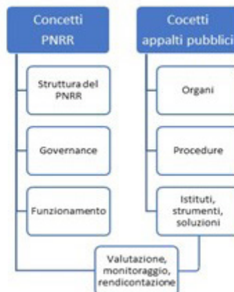
Figura 1: Elaborazione del sistema concettuale elaborato per il volume Conoscere il PNRR. 150 parole chiave per capire regole, strumenti e funzionamento del Piano Nazionale di Ripresa e Resilienza (Cozzio 2022).

Sono 14 i concetti che riguardano la “Valutazione, il monitoraggio e la rendicontazione” che congiungono il dominio specifico del PNRR con quello relativo alla legislazione italiana degli appalti pubblici: attività di controllo e di audit; doppio finanziamento (divieto del); frode; Italia domani (portale di); opzione semplificata in materia dei costi (OSC); rendicontazione di milestone e target; rendicontazione finanziaria; servizio di monitoraggio del PNRR; servizio di rendicontazione e controllo; sistema informatico unitario; Valutazione Ambientale Strategica (VAS); Valutazione d’impatto del PNRR; Valutazione d’Impatto Ambientale (VIA); Valutazione d’Impatto Sociale (Fig. 1).